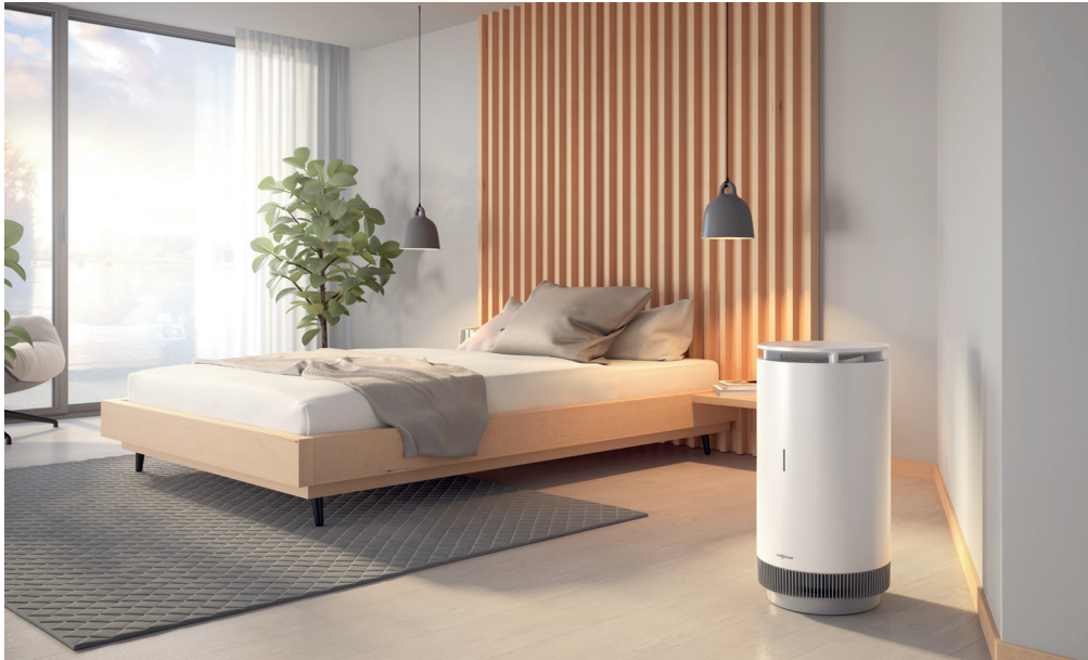
Einsatz des Viessmann Luftreinigers Vitopure im Schlafzimmer

Die Viessmann Luftreiniger Vitopure sind ideal, um dem wachsenden Bedürfnis nach gesunder Luft in Innenräumen gerecht zu werden.