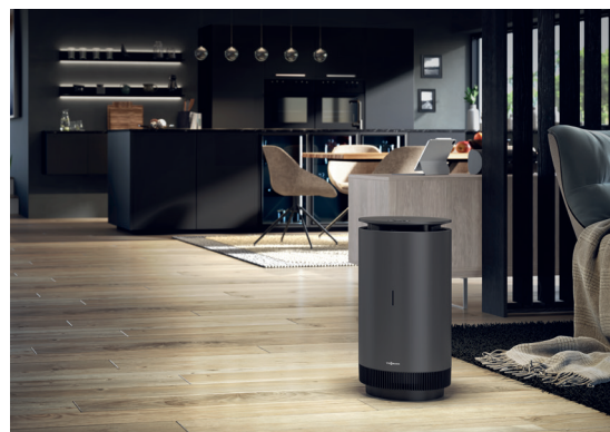
Vitopure im Wohnbereich

Passend zu dem Wohnambiente ist Vitopure in den Farbtönen Leinenweiß oder Lavaschwarz erhältlich.