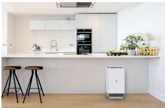
Vitopure in der Küche

Reinigungsleistung: 250, 350, 450 m 3 /h