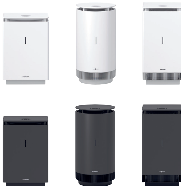
Vitopure 250 m 3 /h